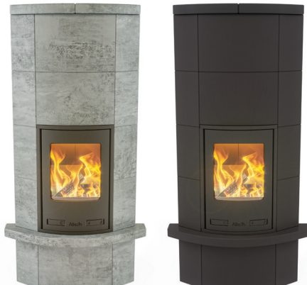
GRANDE MASSIV INCLUSIEF PLATEAU