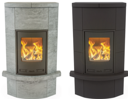
MASSIV INCLUSIEF PLATEAU